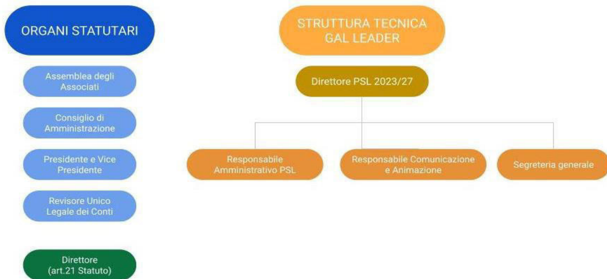
Figura 1. Organigramma generale del GAL e struttura tecnica GAL Leader